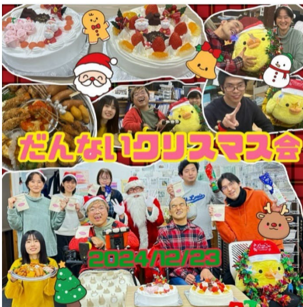
npodannai 12月23日、だんないクリスマス会を開催しました。 今年最後のイベント。 今回もつるやサンタがやってきました！ みんなでおしゃべりしながら、楽しい時間を過ごすことができよかったです！ 来年もよろしくお祈りします！