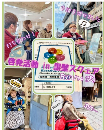
npodannai 1月14日、バリアフリー調査&ステッカー貼付依頼活動を行いました。 予定していた地域が定休日のお店ばかりだったので、原点に戻って黒壁スクエア帯を回りました。 今回は、当事者それぞれの動きを分けて、別々の店舗にステッカー活動を行いました。 一気に5店舗とこれまでにない多さの店舗に申請していただくことができ、寒い中で活動して良かったなと思いました。 みなさん、ありがとうございました！