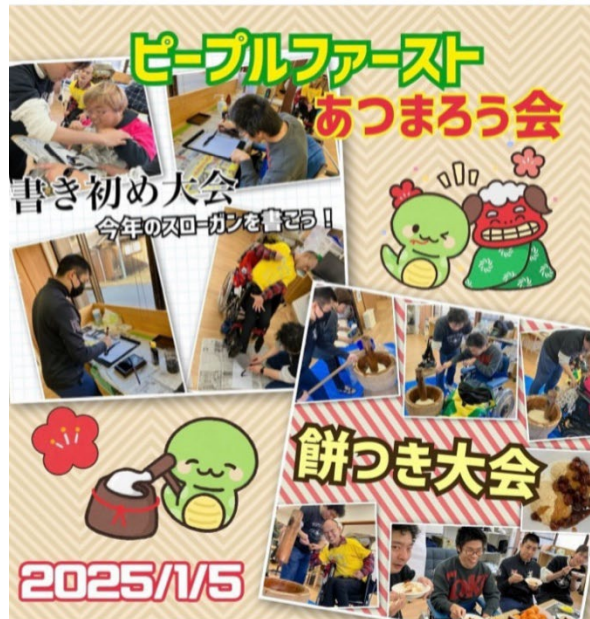
npodannai 2025年がスタートしました！ 1月5日、ピープル書初め大会を開催しました。 思い思いの字を書きました。 その後は、だんない初のもちつき大会！ コロナ前に、ご近所さんから寄贈していただいた杵と臼、ようやく活用することができました！ もちつきについて何もわからない私たちにご協力いただいたのは、これまた別のご近所さん。 ご近所さんのお力添えなしには、成しえなかった企画。 みなさんに感謝感謝の一日でした！